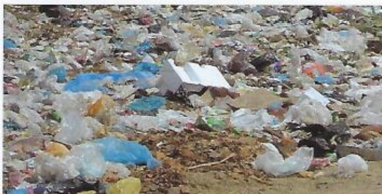
Nicht nur im Kongo ein Problem: Plastikmüll. Hier in Karachi/Pakistan.

Kostenlose Plastiktüten sind künftig auch im Kongo verboten. SPD-Politiker Leinen sprach von einem "Krebsgeschwür, das nicht weiter wuchern darf".