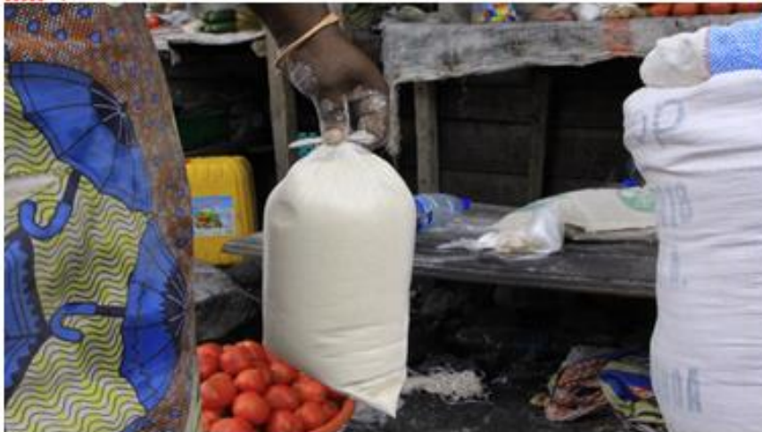
Marktfrau, die Maniokmehl in Goma verkauft (Buch, 2018).

Die DR Kongo als größtes zentralafrikanisches Land hat im Sommer 2018 ein Verbot der Herstellung, des Imports, des Verkaufs und der Verwendung von Plastiktüten erlassen