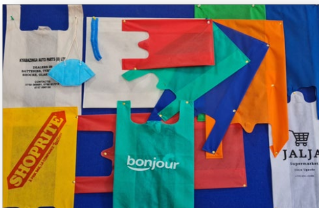
Sortiment unserer Taschen