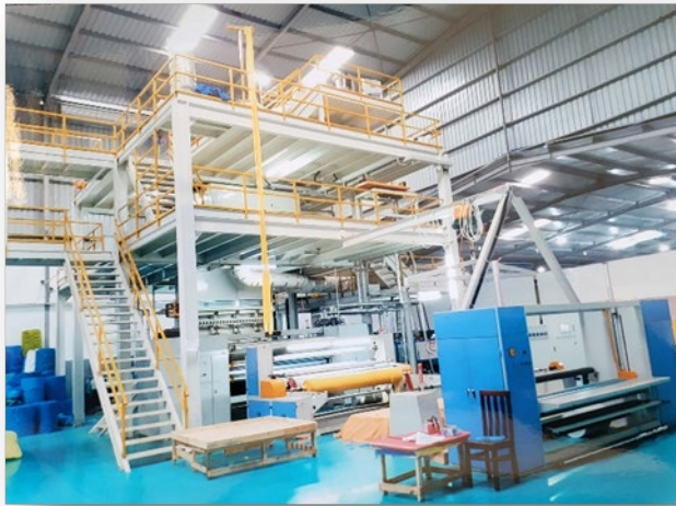
Unsere Non Woven Rollen - Produktionsanlage