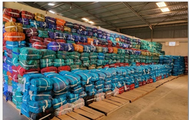
Fertige Taschen verpackt nach Größen