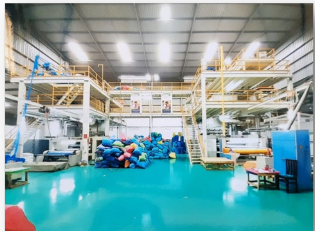
- Kapazität pro Tag: 8 tonnen