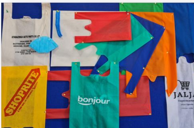
Sortiment unserer Taschen